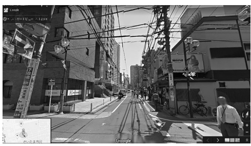
無料公開されている2014年当時の画像（上） 同じ場所を445万円かけて作成したVR（下）