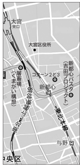
市役所移転先の3候補地

市が移転候補地として発表したのは、①屠畜場(食肉中央市場)、②コクーン2と3、③長距離バスターミナル用地の3カ所です。 ③は17年2月20日の総合政策委員会で、私が「バスターミナル用地に1階はバス乗り場、その上に市役所を建設するのは可能か」と問いかけ、同年9月議会で「吉田プロジェクト」として提案した場所です。