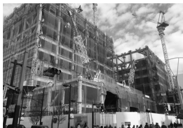
市民会館が入る建設中の再開発ビル

大宮市民会館はかつて『8時だヨ!全員集合』など人気番組の中継が行われましたが、市民会館は本来市民が演劇やコンサートなどを楽しむための施設です。莫大な公費を投じて「欠陥市民会館」を建てる清水市政のやり方に、私は12月議会で改めて反対しました。