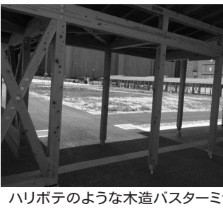
ハリボテのような木造バスターミナル

自粛を求める市民の請願を提出。5月8日の本会議で賛同するように呼びかけましたが、政務活動費を使っている各会派の議員たちは、誰も理由を言わずに、黙々と反対して否決されました。