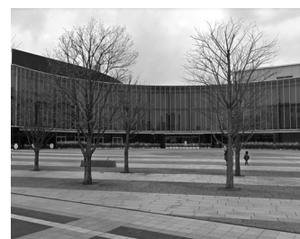
プラザノース前の市民広場

プラザノースがオープンして12年が経ちました。交差点に面した「市民広場」は、市や警察のイベントで年に数回行っただけです。