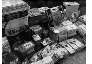
韓国の食料宅配セット

私が3月27日の議運で自宅待機者への食事提供を質問すると、保健所長は「検討できていない」と言い、4月10日の議運で宅配弁当業者との提携を提案したところ、「自宅待機者に食事を届ける国の制度がない」と逃げて