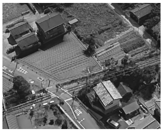
現在は畑が多い西大宮の沿線

JRはまだ複線化に思っていないので、複線化後の具体的な線形を発表するわけがありません。せっかく線路脇に将来の複線化に備えた道路を作るのに、幅が1メートル足りない。