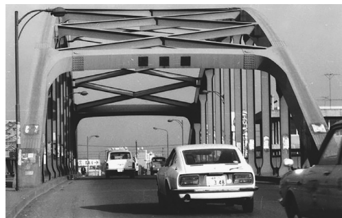
高度成長時代(1970年)の大栄橋

議会では必ずマスクを着用する、サーモグラフィで検温する、委員同士の席を離すなどの感染防止対策をしていますが、議会の開催日を減らして「職務放棄」することは許せません。