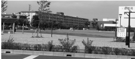
記念碑が建つ予定だった新都心公園

「聖火リレーをやらなかったのに聖火リレー記念碑が建つ」というおかしな事態を防ぎ、8000万円を無駄にせず済んだのは幸いです。