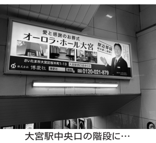
大宮駅中央口の階段に…