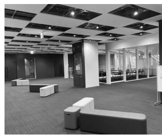
放置されている5階

5階の空きスペースは市民グループに開放を 浦和駅東口のコミセンは料金が安いだけでなく、同じ建物の市民活動サポートセンターには市民グループが会合や作業に無料で使えるテーブルがあります。ま