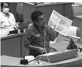
住民説明会の資料を手に追及

地元が要望したのは市が建設する運動施設や多目的広場だったのに、民間企業の営業所が敷地の半分を占めかねません。私は9月8日の本会議で追及しました。