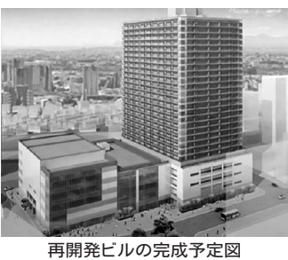
再開発ビルの完成予定図

大宮門街は総事業費658億円のうち、市の補助金は土地の現物支出を含めて491億円（うち市民会館