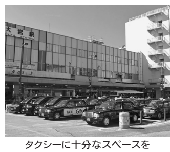
タクシーに十分なスペースを

私は18年11月のまちづくり委員会でも「高齢者や障害者、重要なお客さんの送迎に不便だ」と批判。新たな案では1階はバスとタクシー、地下はマイカー用になりました。