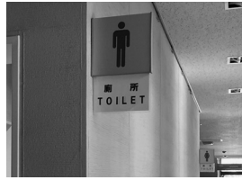
男子用も女子用も「厕所」

これらの路線バスを順天堂大学病院まで延長すれば、市内各地からの通院が楽になります。そこで9月12日の一般質問で提案しました。